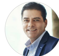
Jorge Manzur PUNTE ROMANO BEACH RESORT & SPA www.punteromano.com